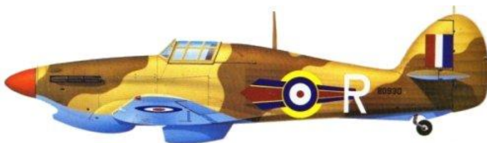
Hawker Hurricane Mk.IIb/trop, No. 73 Fighter Squadron, Severní Afrika, léto 1942.