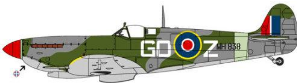
Supermarine Spitfire Mk.IXC, MH838, GO-Z, No. 94 Fighter Squadron.