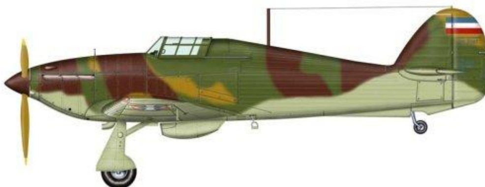
Hawker Hurricane, Jugoslovensko Kraljevsko Ratno Vazduhoplovstvo.