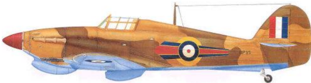
Hawker Hurricane Mk.IIc/trop, No. 73 Fighter Squadron, Severní Afrika, květen 1941.