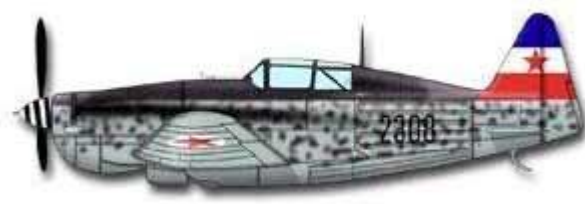
Morane-Saulnier M.S.406, Partizanska Eskadrila NOVJ.