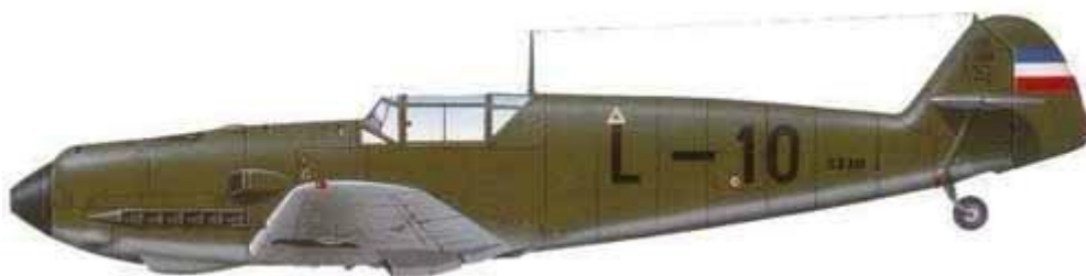
Messerschmitt Me-109E-3, Jugoslovensko Kraljevsko Ratno.