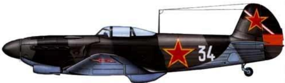
Yakovlev Yak-1, 113 Fighter Regiment, 11. Fighter Division, únor 1945 .