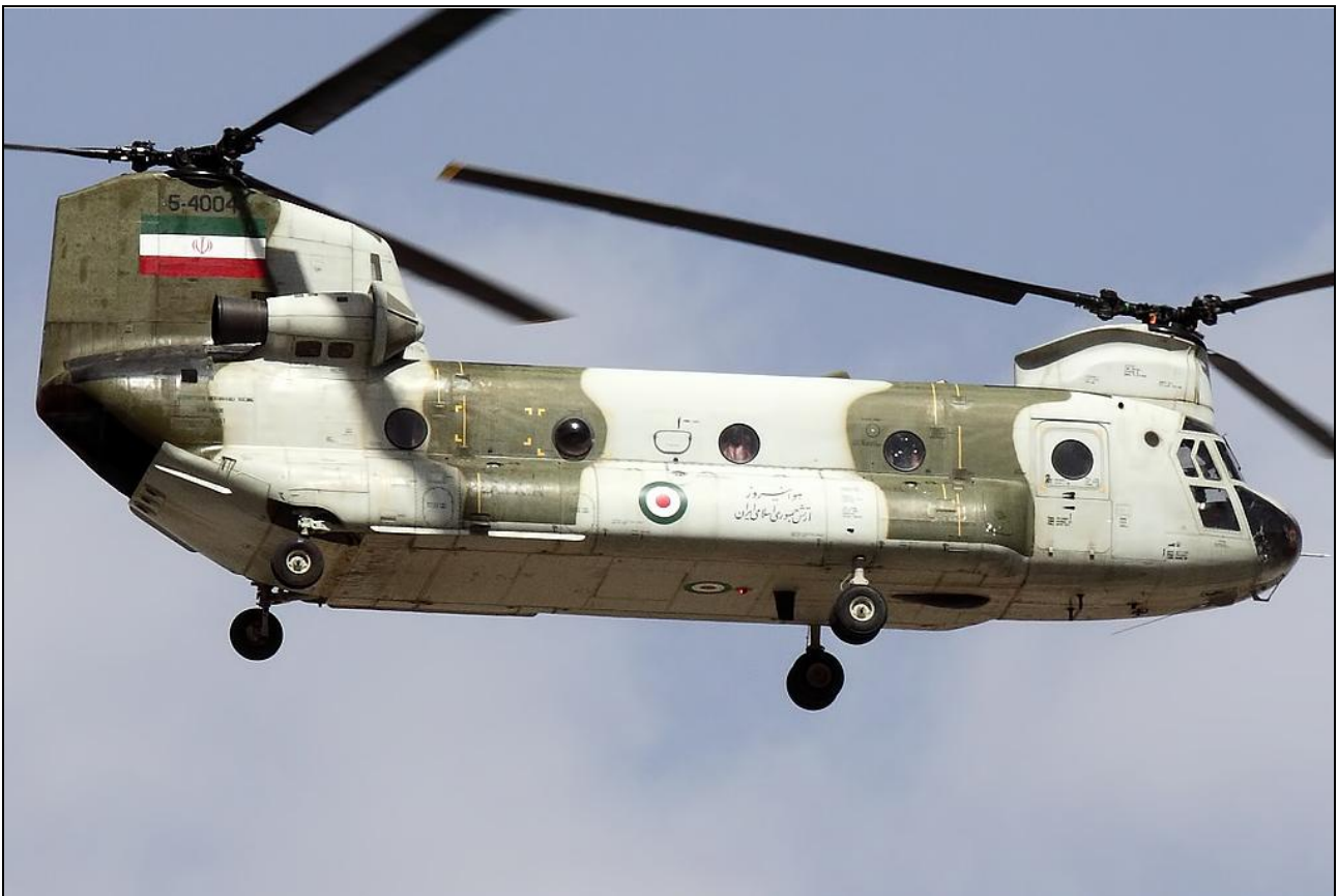
Boeing CH-47 Chinook, Islamic Republic of Iran Air Force نیروی هوایی ارتش جمهوری اسلامی ایران .