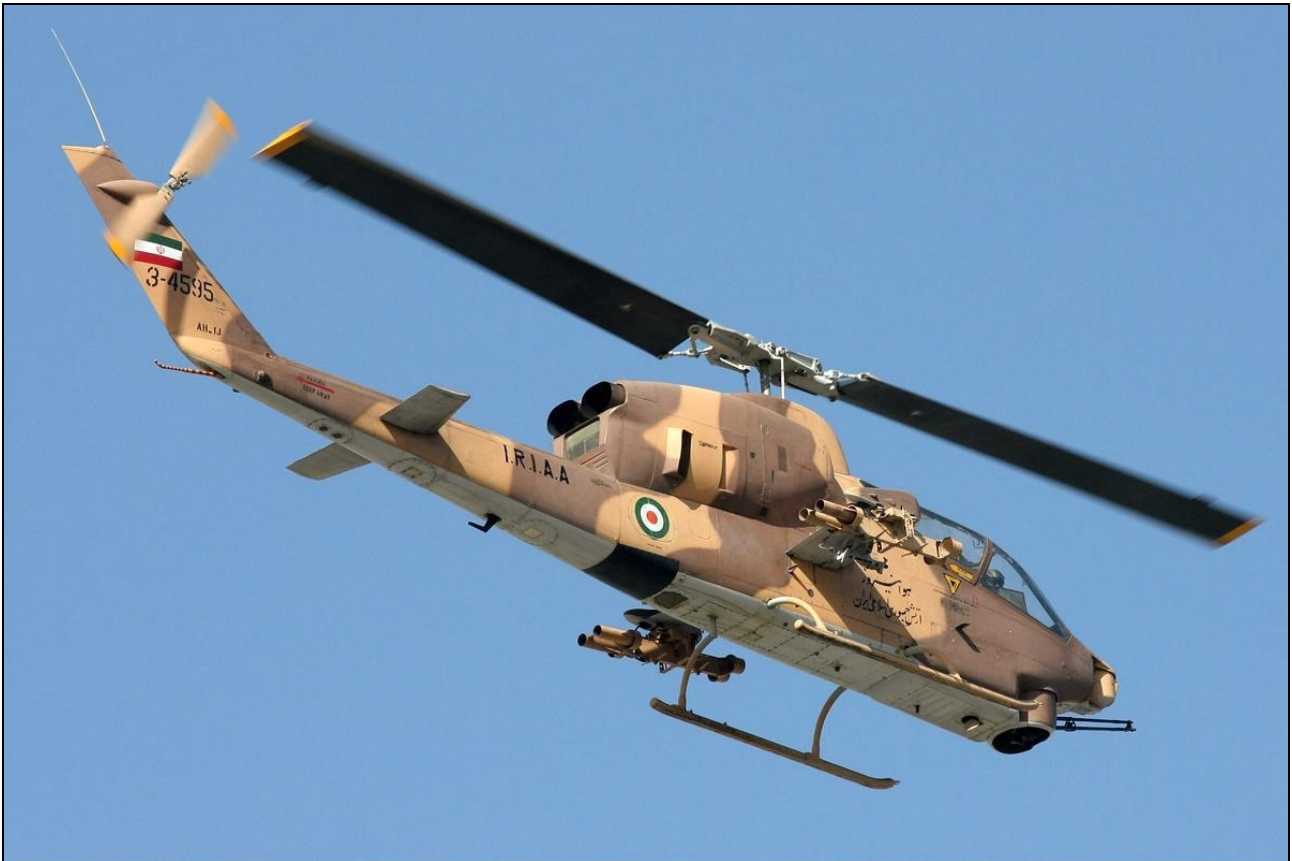
Bell AH-1J SuperCobra, Islamic Republic of Iran Air Force نیروی هوایی ارتش جمهوری اسلامی ایران .