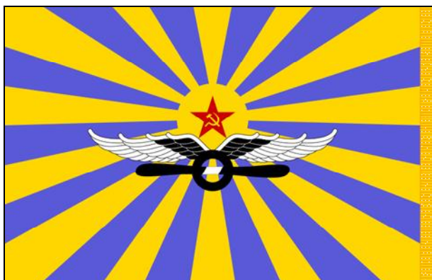
vlajka sovětského vojenského letectva Военно-воздушные силы Советского Союза

AH-1J Bell AH-1 SuperCobra CH-47 Boeing CH-47 Chinook MiG-23MLD Mikojan-Gurjevič MiG-23