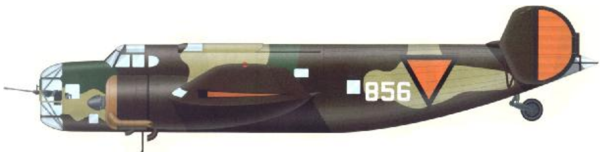
Fokker T.V, Bomb Va.