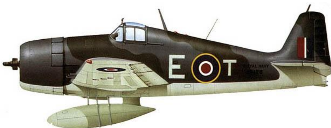
Grumman Hellcat F.Mk.I, 1839 NAS, FAA.