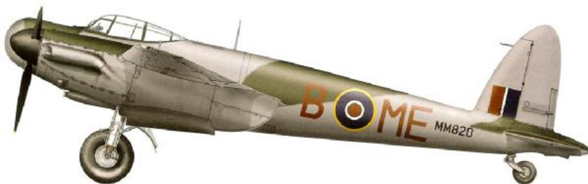
de Havilland Mosquito Mk.30, 488 Squadron, 140 Wing, 2nd Group, 2nd TAF, RAF