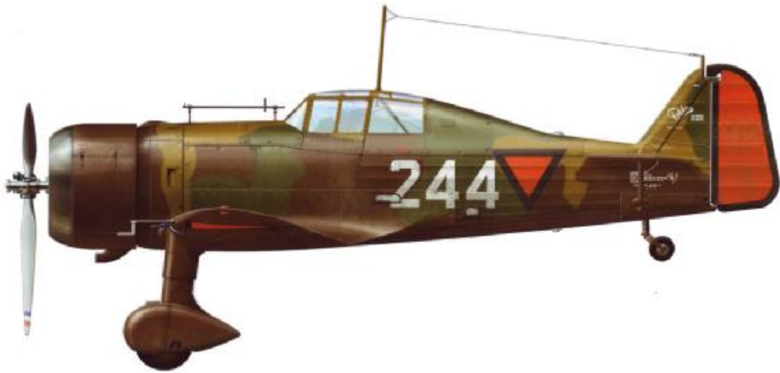
Fokker D.XXII, 1e Ja.V.A.