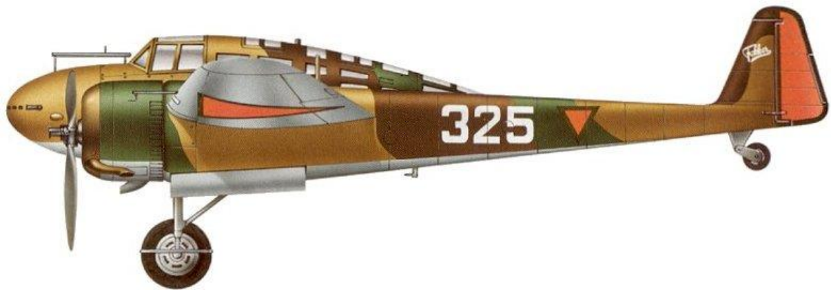
Fokker G.IA, 4 Jachtvliegtuigafdeling