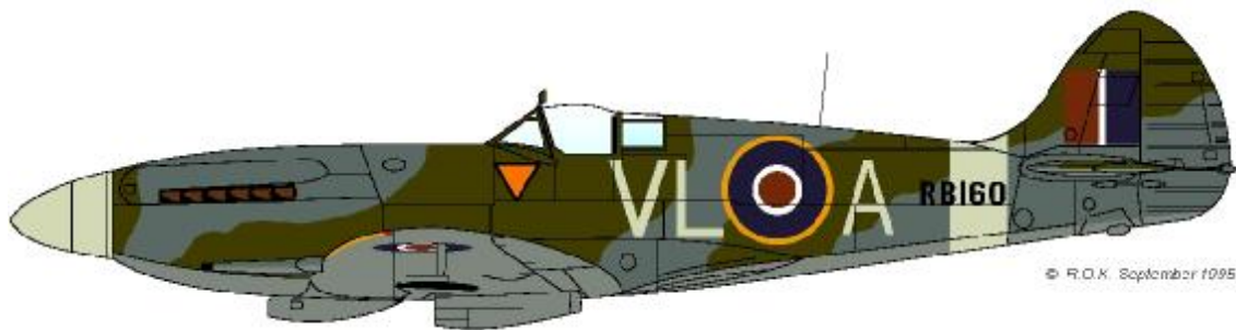
Vickers Supermarine Spitfire F.Mk.XIVc, VL-A, RB160, 322 (Netherlands) Squadron, RAF, Acklington, Northumberland, April 1944.