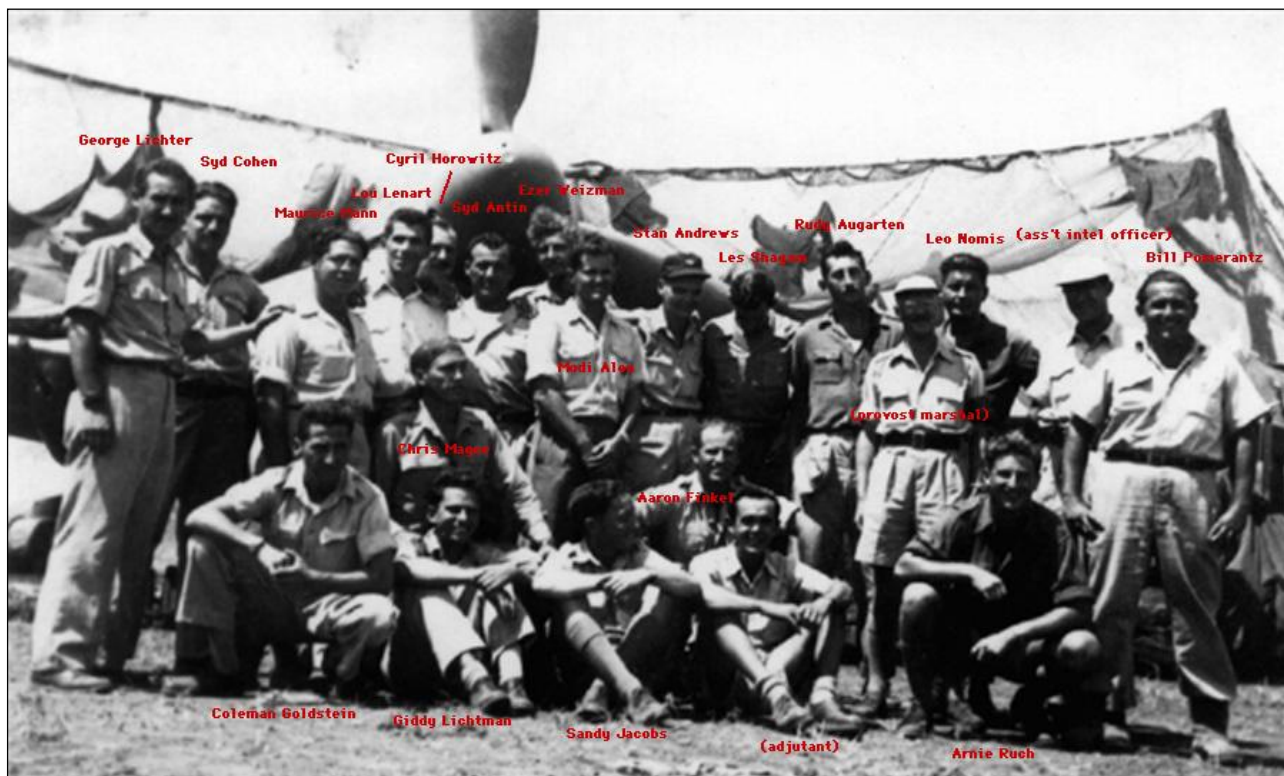
Personál 101. Tayeset