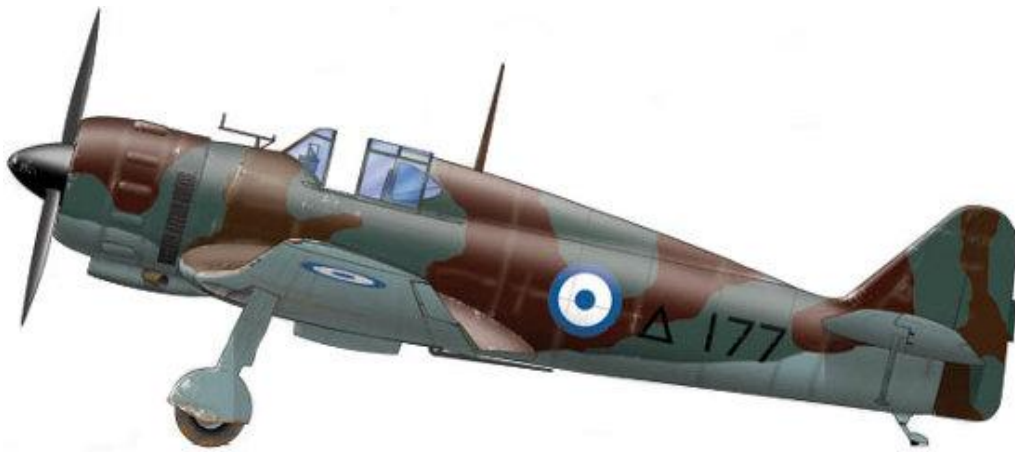
Marcel Bloch MB.151, Elliniki Vassiliki Aeroporia.