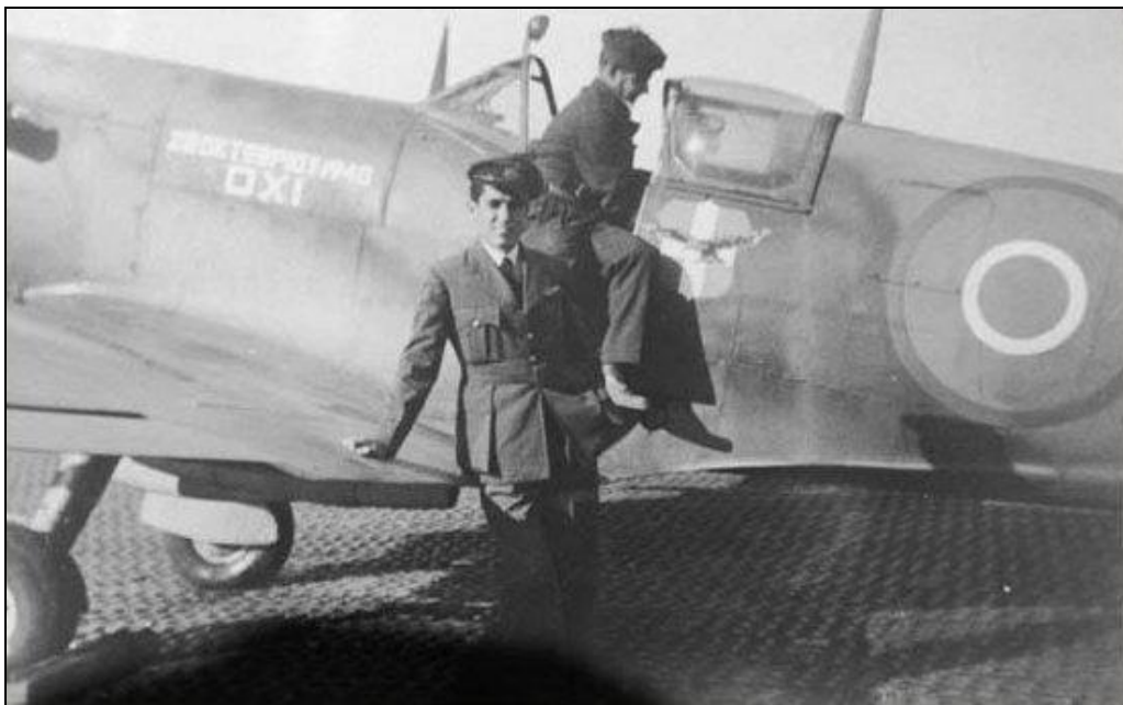
Supermarine Spitfire Mk.VB of 336 Squadron Royal Hellenic Air Force, Itálie, 1944.