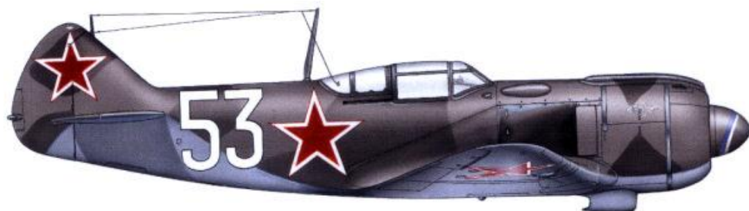
Lavočkin La-5FN, "bílá 53", 1. československý samostatný stíhací letecký pluk.