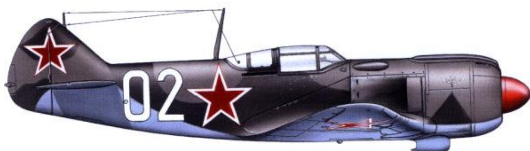
Lavočkin La-5FN, "bílá 02", 1. československý samostatný stíhací letecký pluk.