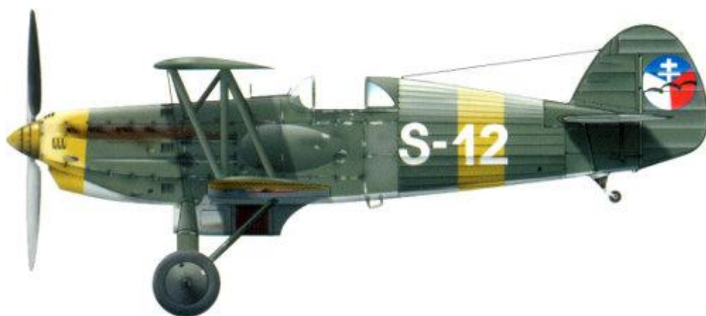
Avia B.534-IV, Kombinovaná letka