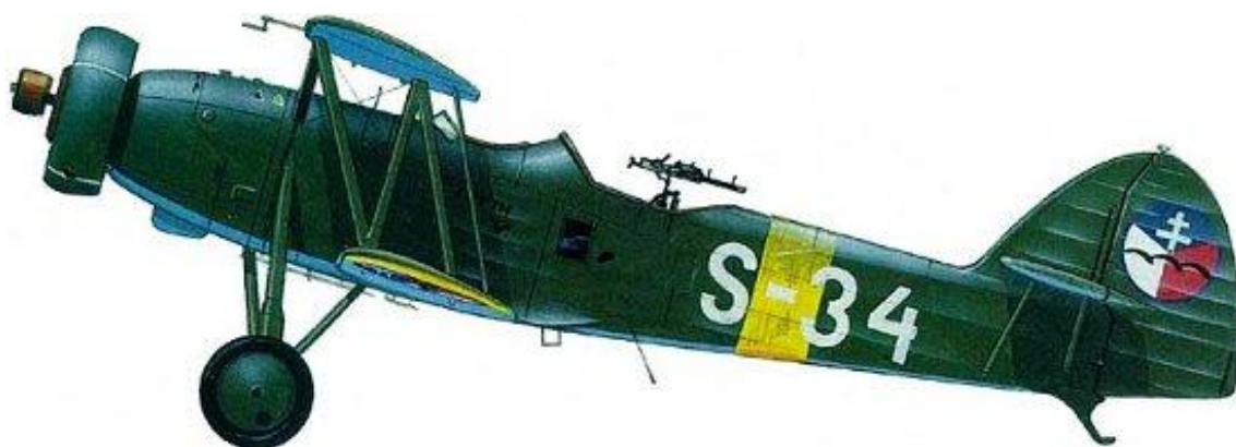
Letov Š-328, Kombinovaná letka