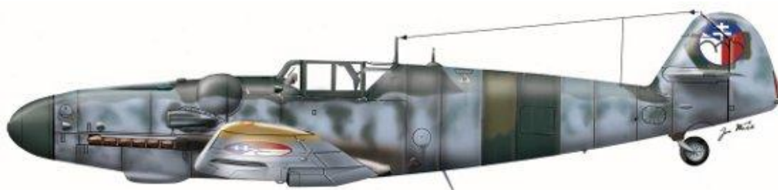
Messerschmitt Bf 109G, Kombinovaná letka