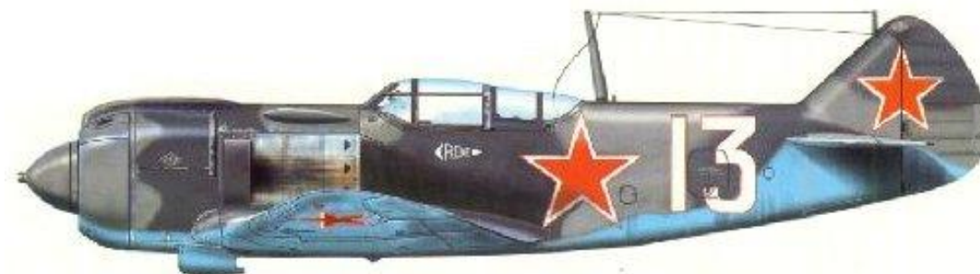
Lavočkin La-5FN, "bílá 53", 1. československý samostatný stíhací letecký pluk.