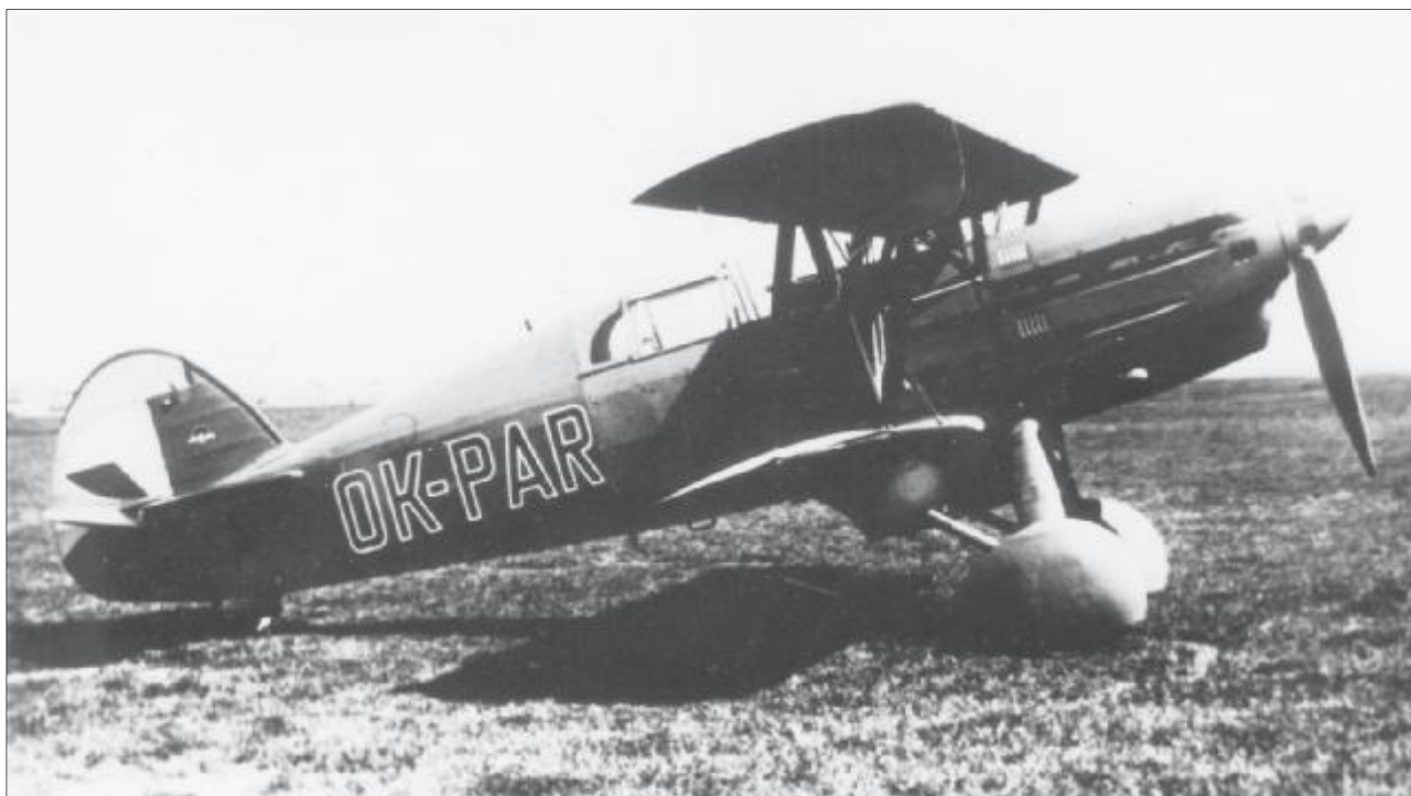
Mezi letouny určené pro provoz ve ztížených povětrnostních podmínkách patřily stroje Avia B.534 IV. série. Zde OK-PAR, kolem roku 1938.