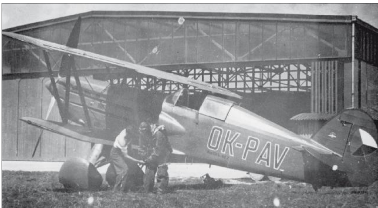
Avia B.534.387 OK-PAV. ČLH Moravská ostrava / Německý Brod.