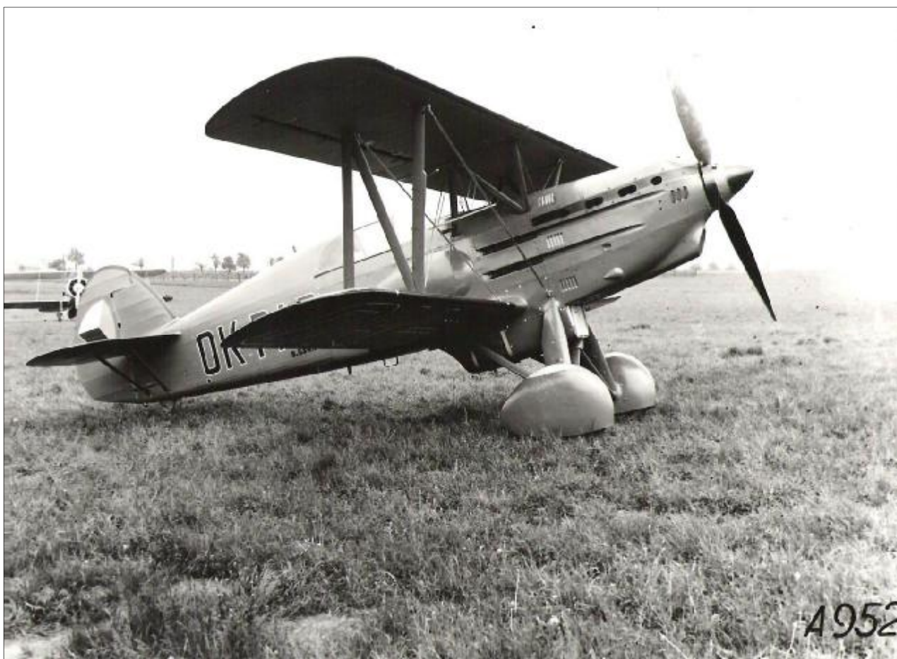
Avia B.534.195, OK-PAR, letoun od 12. 6. 1937 létal u ČLH Hradec Králové.