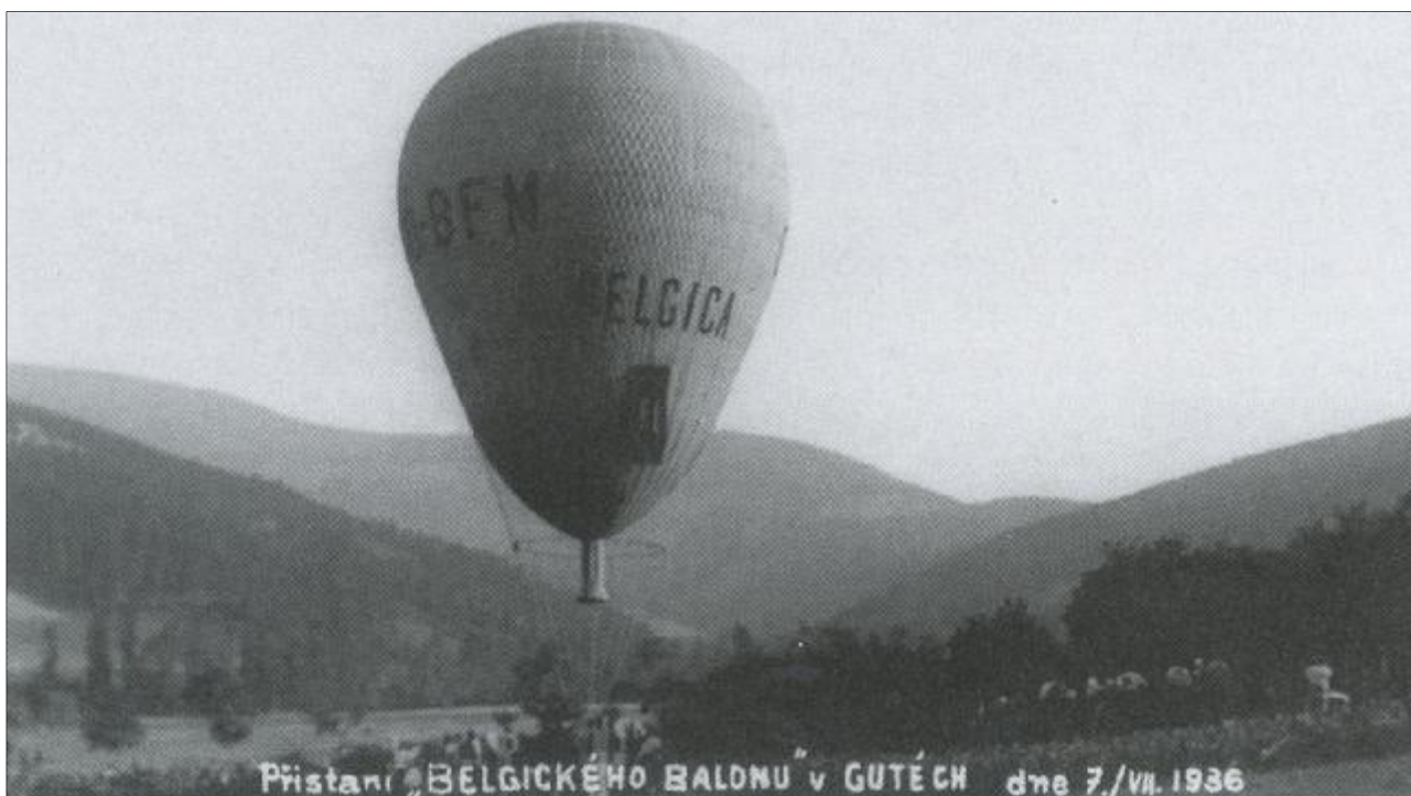
Belgický balon po přistání v Gutech 7. července 1936 - taková událost stála za zveřejnění na dobové pohlednici.